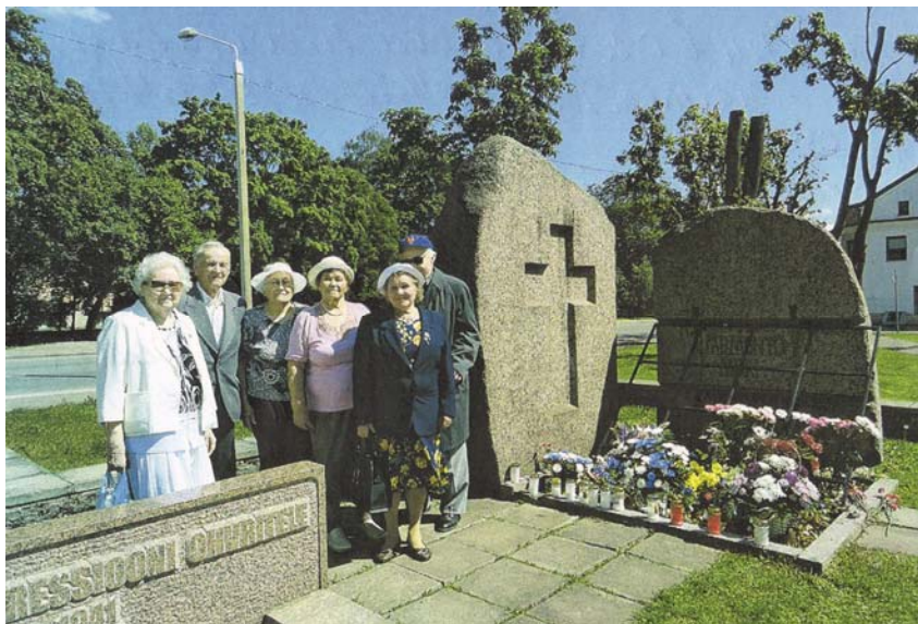
Narva Memento liikmed leinapäeval 14. juunil raudteejaama mälestusmärgi juures