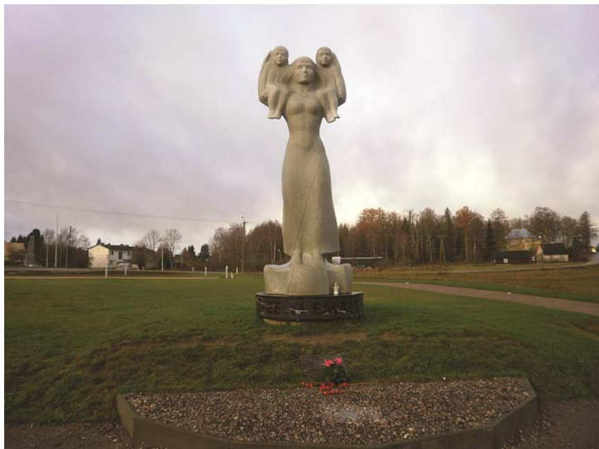
Eesti Ema monument. avatud Rõuges 26. juunil 2010

Skulptorid Ilme ja Riho Kuld